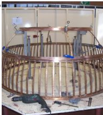
CONSTRUCCIÓN. La elaboración final es casi artesanal.

Por todas estas circunstancias, y por el especial carácter que tiene la Lotería de