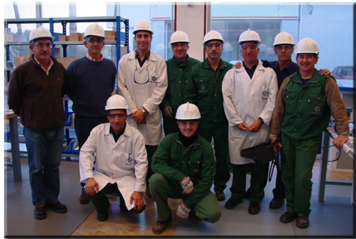
Medidas Seguridad Siglo XXI Dpto. Sistemas/Electronica

Tantas curiosidades que a veces nos planteamos su propia veracidad. El mundo avanza y el trabajador va haciendo que ello sea posible, por eso la intención de este artículo es dar un pequeño homenaje a todos aquellos trabajadores que soñaron con el mundo actual y que no han podido disfrutar de él como hoy lo hacemos nosotros.