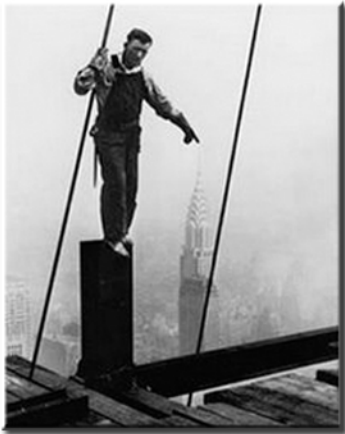
Medidas Seguridad años 50

Todo parece cambiar y abrirse camino en la Historia del obrero, todo lo que antes parecía imposible hoy en día se hace realidad, atrás queda el trabajador que desmantelaba barcos en el Astillero de Cádiz con tan solo un pantalón, unas botas usadas y tal vez una gorra para quitarse alguna hora de sol, hoy en día, ni el hombre que trabaja en el campo lo hace en estas condiciones, también queda atrás el soldador que usaba unas gafas de sol usadas como medida de precaución contra las radiaciones de la máquina de soldar o el electricista que en condiciones penosas se ganaba la vida sin unos zapatos bien aislados o sin ni siquiera tener unos guantes para proteger sus manos de la electricidad o los cortocircuitos, también se tiene el recuerdo de ver al albañil encaramado a un tablón jugándose la vida como si de un equilibrista se tratara, hay que agradecer la inversión por parte de la empresa y la dedicación de todo el colectivo laboral y ciudadano por haber hecho posible todas las incorporaciones pertinentes para la prevención laboral y las medidas sanitarias oportunas.